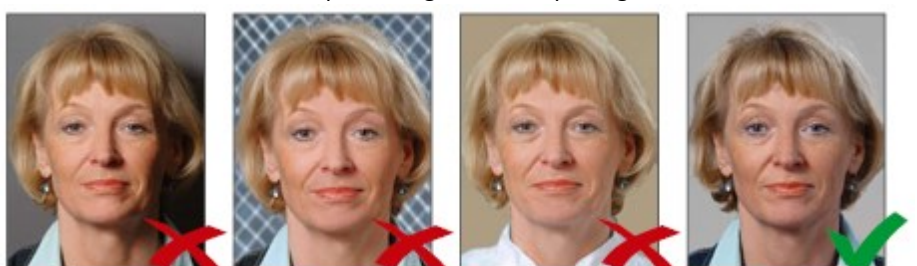
Đổ bóng phía sau Hình nền gây nhiễu Nền không có độ tương phản